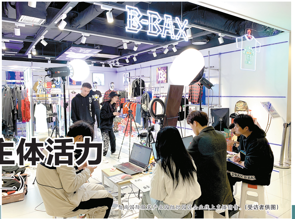
智尚国际服装产业园组织园区企业线上直播销售。