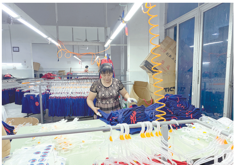
华林工贸公司工人在车间内忙碌。

成绩来之不易。古林镇将坚定信心，奋发实干，攻坚克难，力争创优，全力做好“六稳”工作，落实“六保”任务，坚定不移稳住实体经济，全力以赴抓招商项目，千方百计扩大有效投资，积极引导全镇上下特别是各类市场主体增强信心，推动全镇社会经济稳步发展。(陈朝霞 整理)