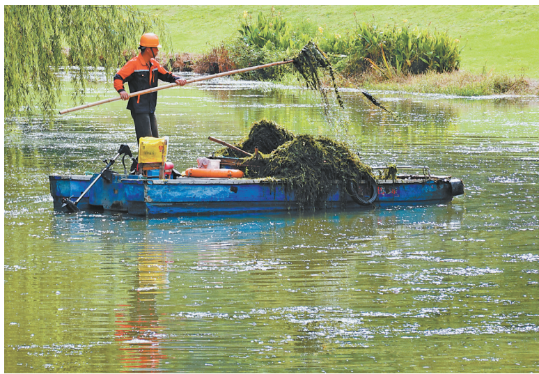
保洁人员对双杨河面水草及漂浮垃圾进行及时打捞。

与全省各地一样,近年来我市坚定不移地走绿色发展之路,持续整治环境污染,不断提升生态优势,接续培养生态文化,生态文明建设取得了历史性的成就,并由此带动了经济的转型升级和可持续发展。如今,我市城乡呈现出生态环境和经济发展相得益彰、相互促进的良好局面,尤其是农村面貌大为改观,全市涌现出一大批各具特色的“美丽乡村”,乡村旅游持续火热,“美丽经济”方兴未艾。乡村已成为“两山”理念忠实的实践者和最大的受益者。