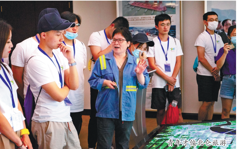
修游学品牌,增加城市品牌影响力的机会。”北仑区文化和广电旅游体育局相关负责人表示,将以