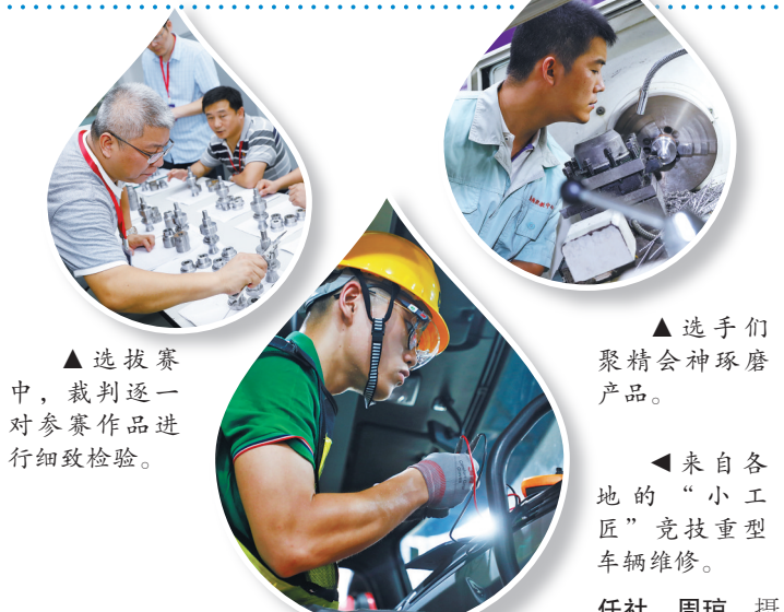
▲选拔赛中，裁判逐一对照参赛作品进行细致检验。

三个组别，重点以我省数字经济、先进制造业、民生服务业、现代农业等领域的重要或紧缺职业(工种)为主，共涉及数字经济、现代服务业和先进制造业三大领域的30个比赛项目。其中，职工组设立25个项目，分别是数控车工、加工中心、焊接、塑料模具工程、汽车技术、工业机器人、汽车整车制造、数控机床装调、砌筑、起重装卸机械操作、集卡牵引车、机修钳工、制冷与空调、信息安全、计算机设备装配、养老护理、评茶、精细木工、西式烹调、茶艺、美发、时装技术、公交客车驾驶、园艺、商品展示技术；学生组设立2个项目，分别是电气装置、重型车辆维修；残疾人组设立3个项目，分别是IT系统网络管理、桌面出版、海报设计。赛事的主赛场将设在宁波市国际会展中心，在宁波技师学院和宁波舟山港集团设立两个主要分赛场，另有砌筑和公交客车驾驶两个项目分别在第二技师学院和宁波公交公司进行。