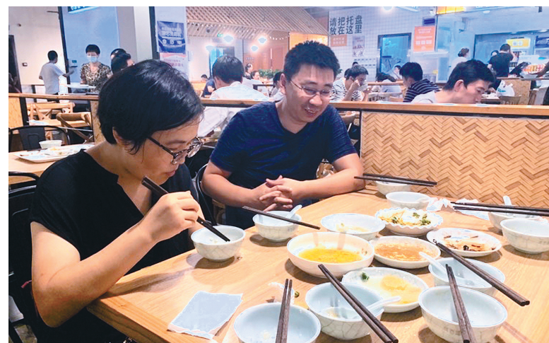
“光盘”在鄞州区商务楼宇已成为常态。

下一步，鄞州区将进一步细化商务楼宇的监督管理制度，对浪费行为进行监督和曝光，让“光盘”“打包”成为楼宇内每一位白领的日常习惯。