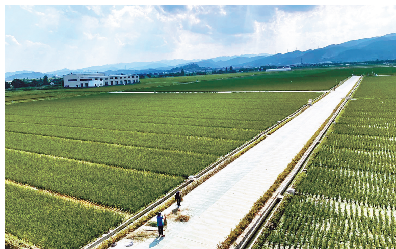
海曙区吉林大田数字农业项目核心区，农户正在辛勤劳作。

“作为宁波现代农业四大先导区之一，慈溪市现代农业产业园聚集了现代生产要素，以管委会