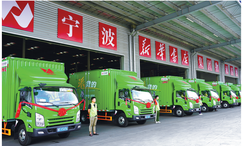
昨天，宁波新华书店集团与中通物流集团战略合作暨智能共配中心开仓仪式在宁波奉化方桥举行。

本报讯（记者陈青 通讯员陈吉）宁波新华书店集团与中通物流集团携手共建的智能共配中心昨日在奉化方桥正式启用，双方签订了战略合作协议。