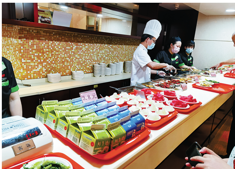
变套餐为点餐，变固定分量为“大份”“小份”，就餐人员按需索取，极大地减少了浪费。

为响应号召，深入推进“光盘行动”，8月14日，市机关事务管理局会同市直机关工委组建“光盘行动督导员”志愿者队伍，由市行