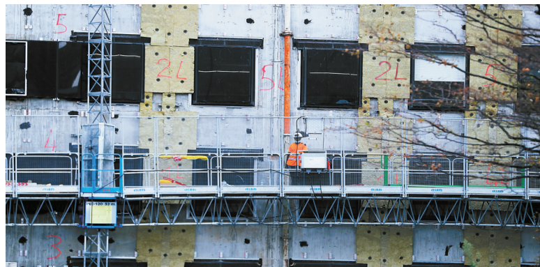
这是8月20日在法国巴黎附近的拉德芳斯商务区拍摄的建筑工地。经济合作与发展组织(经合组织)26日发布新闻公报说,根据初步评估,其成员第二季度实际国内生产总值环比下降9.8%,是有记录以来最大降幅。