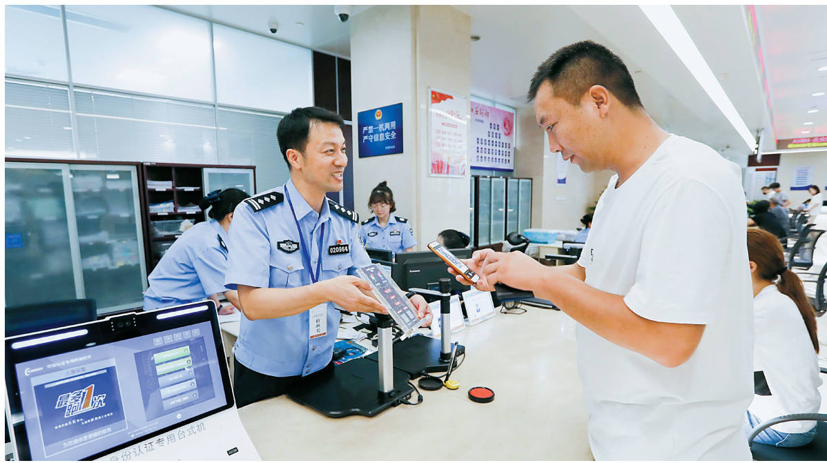
昨天,在宁波市行政服务中心公安服务窗口,工作人员为市民办理业务。

一年多来,宁波的“无证件(证明)办事之城”改革稳步推进,克服了种种难关,取得了显著成绩。在昨天的新闻发布会上,记者获悉,我市以“宁波电子证明共享核查平台”和“阿拉警察”APP证照(证明)电子化建设为抓手,全面深入推进减证便民工作。截至目前,不需要群众出具