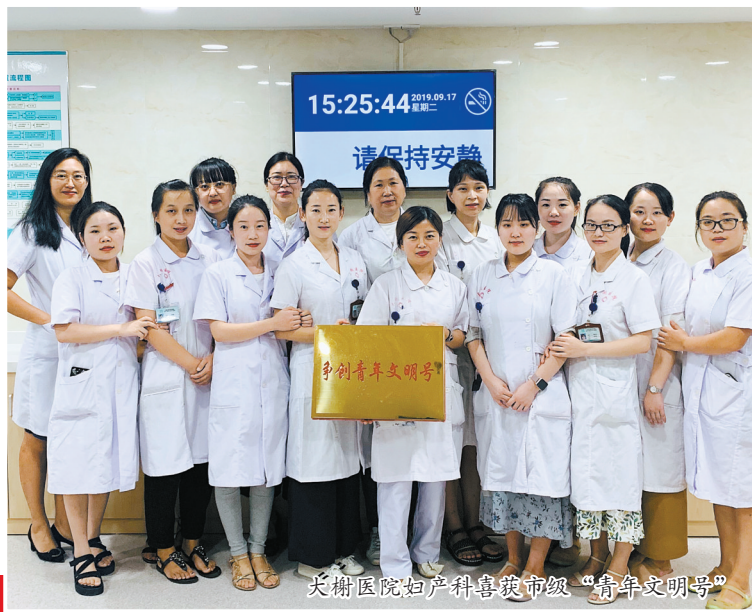
大榭医院妇产科荣获市级“青年文明号”