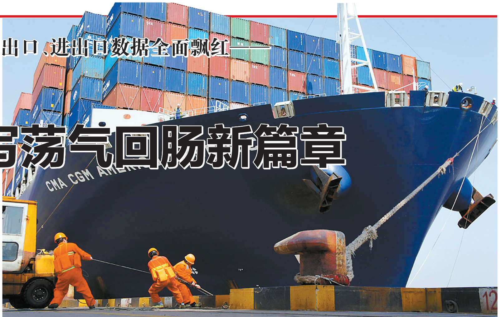
巨轮停靠宁波舟山港。(资料图片)

疫情之下,节节攀升的外贸数据,与复杂严峻的贸易形势形成背离,成为宁波外贸发展的亮丽底色。