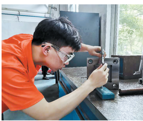
“技能之星”职业技能竞赛，成为不少技能人才脱颖而出的舞台。图为选手在参加不同门类的比赛。