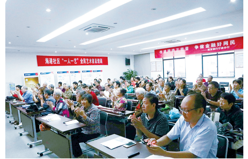
浦发银行开展金融知识讲座。（周婷）

为贯彻落实监管部门关于加大消费者权益保护宣传教育的要求，切实保护金融消费者的合法权益，提升公众金融服务的知晓率、参与率、支持率，营造良好的金融环境，9月18日至19日，浦发银行宁波分行走进镇海海港区社区和鄞州首南街道鲍家套小区开展金融知识宣传活动，向退休老人宣传普及金融知识，增强中老年群体金融风险防范能力。 如今市场上金融产品种类繁多，投资风险高低难辨，产品质量差异较大，而对于普通大众来说这些产品又难以分辨。“江湖险恶骗术多，老当益壮巧破局”，在镇海海港区社区，该行金融讲师以“危机四伏的江湖”和“花样百出的诈骗”开篇，以通俗易懂的方式，生动详细地讲解了新钞识别技巧，以及当今网络诈骗犯罪的主要特征和严重危害，帮助老人们识别新型网络诈骗手段，并强调保护好个人金融信息，千万不要轻易向陌生人转账，从而巧妙破除“旁门左道”。