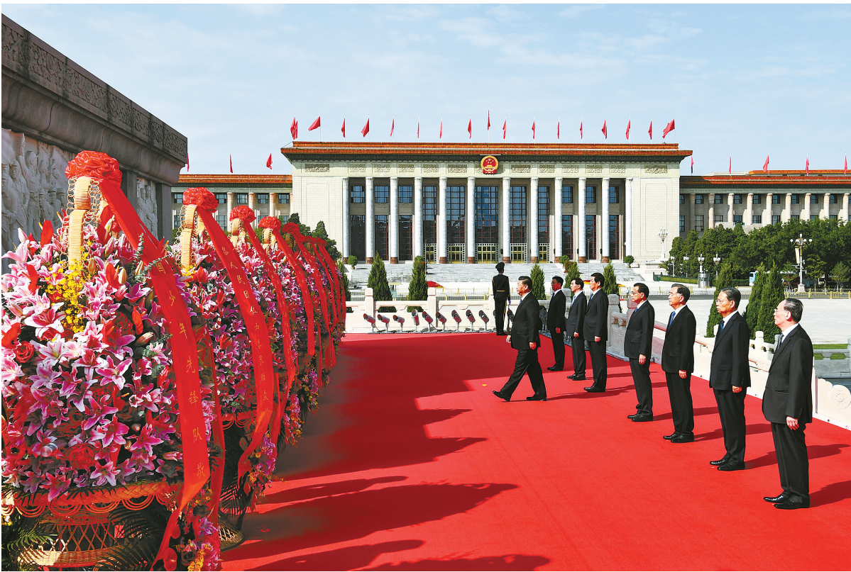
9月30日上午，党和国家领导人习近平、李克强、栗战书、汪洋、王沪宁、赵乐际、韩正、王岐山等来到北京天安门广场，出席烈士纪念日向人民英雄敬献花篮仪式。（新华社发）

中央党政军群有关部门和北京市主要负责同志，各民主党派中央、全国工商联负责人和无党派人士代表，老战士、老同志和烈士亲属代表，国家勋章和国家荣誉称号获得者代表，在京全国抗击新冠肺炎疫情先进个人、先进集体代表，首都各界群众代表等参加了仪式。