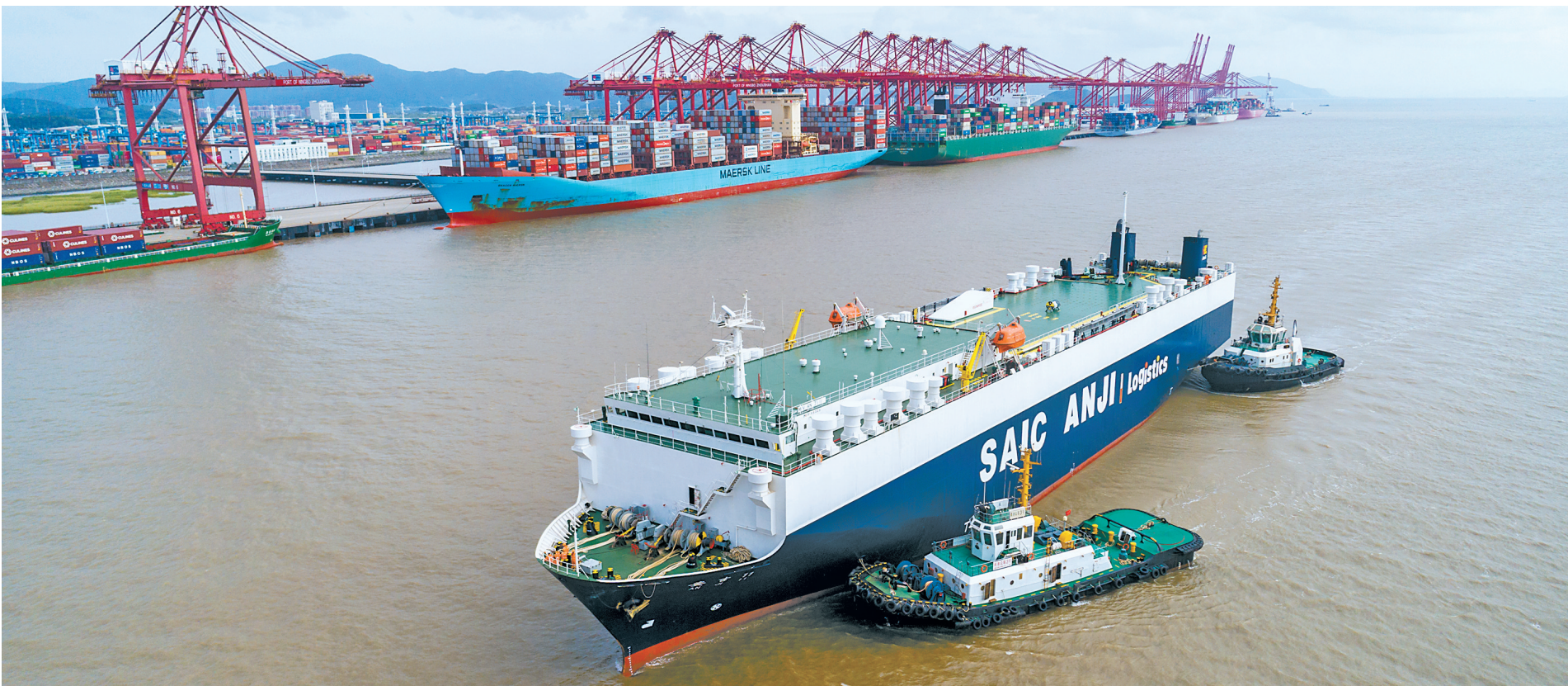
滚装船“安吉11”靠泊宁波舟山港梅山港区。