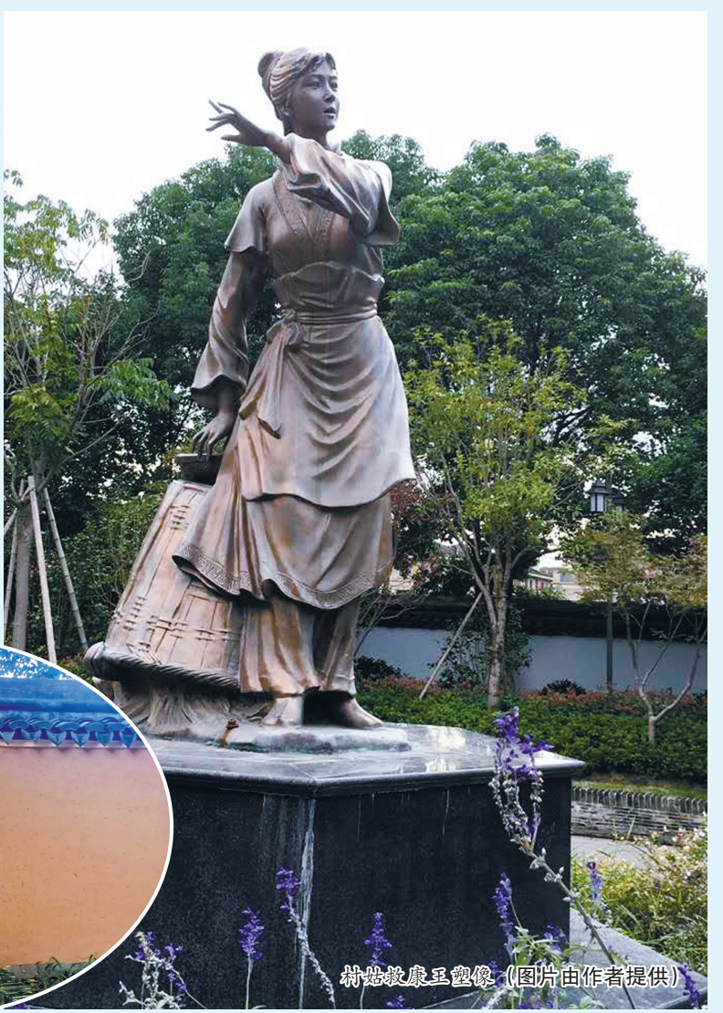
村姑救康王塑像