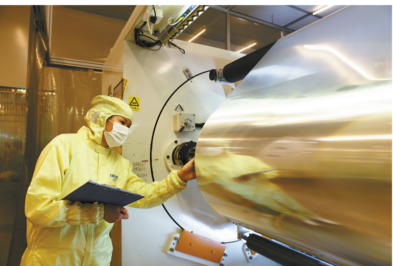
集聚发展的江北膜材料产业

此外，在党建争强的攻坚行动中，江北紧扣基层党建，不断探索党建引领基层治理的方式方法，建立机关党组织与社区（村）党组织结对“三个一”长效机制，积极打造“红色物业”，建立老旧小区改造“党建+共建”推进机制。与此同时，江北全面推广党建引领社区治理“八联工作法”，在包家社区建立全市首个社区环境和物业管理委员会，在全市率先出台《江北区物业服务企业红黑名单管理办法（试行）》《江北区物业服务项目经理考核暂行办法》等文件，社区治理“八联工作法”在全市推广。