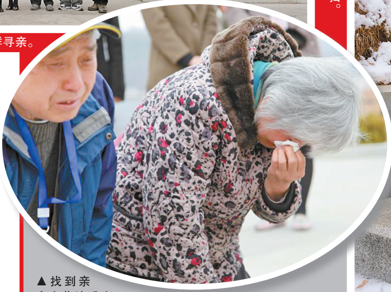
▲找到亲人安葬地后痛哭的烈属。

“一个有希望的民族不能没有英雄，一个有前途的国家不能没有先锋”。那些抛头颅洒热血壮烈牺牲的英雄们，仍被后人所铭记；他们为之流尽最后一滴血的崇高志向，仍在代代传承。