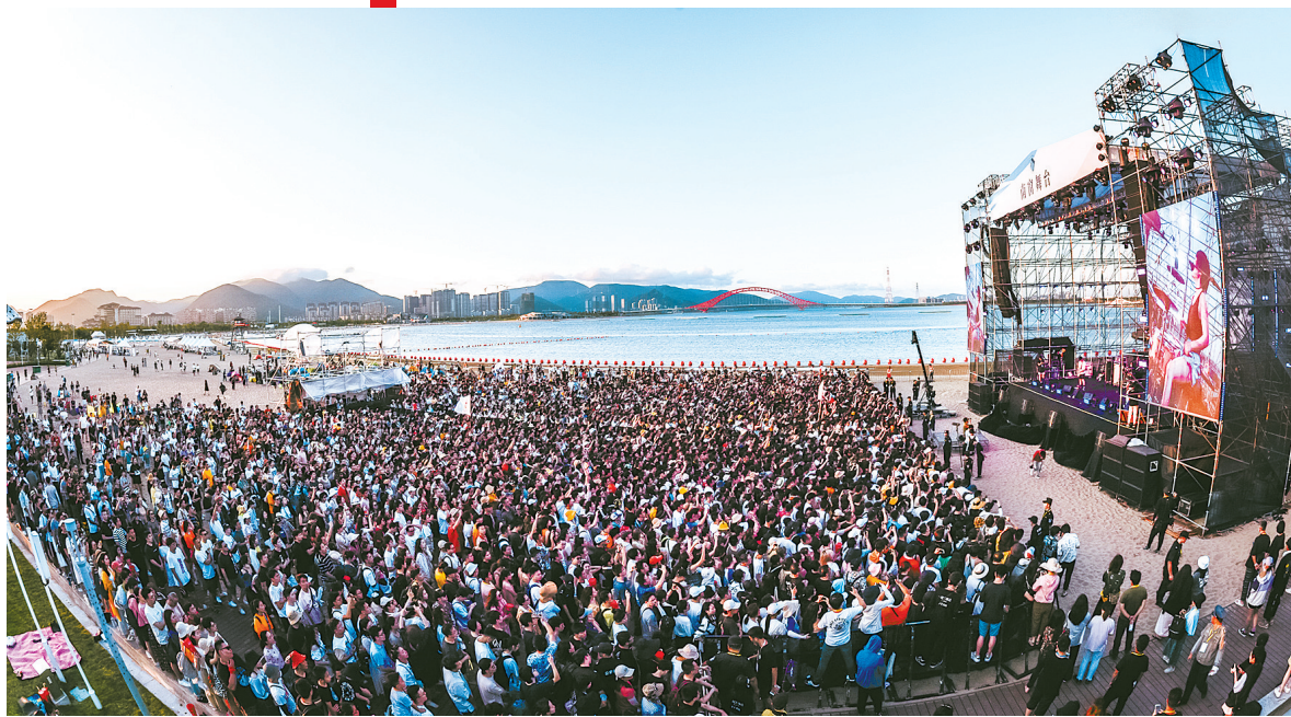
宁波·北仑南甯青年音乐节

时不我待，只争朝夕。北仑区坚持“两手硬、两战赢”，积极打出对冲疫情影响的“组合拳”，抢抓机遇迎难而上，扎实做好“六稳”“六保”工作，持续深化人口、产业、空间结构调整，经济发展在“二季红、半年正”的基础上，做到了“三季进”，社会大局持续保持平安稳定，发展信心进一步增强。