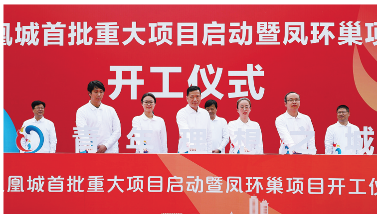
凤凰城首批重大项目启动暨凤环巢项目开工仪式

3月，省市扩大有效投资重大项目集中开工仪式在北仑举行，北仑区金发新材料等10个总投资297亿元的项目位列其中；7月，宁波市“246”万千亿级产业集群示范园首批重大项目开工仪式在北仑举行；10月，长三角一体化发展暨“246”万千亿级产业集群示范园重大项目签约活动举行，德业科技、华东医药等投资140亿元的18个项目又成功签约。