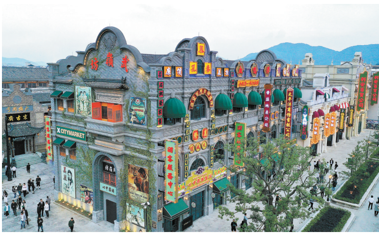
已建成的溪口民国风情街区。

机构名称: 宁波慈溪农村商业银行股份有限公司城北支行城隍庙分理处 机构编号: B0605U233020009 许可证流水号: 00499443 批准成立日期: 1992年11月1日 营业地址: 慈溪市浒山街道解放中街413-417号 邮政编码: 315300 电话: 0574-63083802 业务范围: 许可该机构经营中国银行保险监督管理委员会依照有关法律、行政法规和其他规定批准的业务,经营范围以批准文件所列的为准。 发证机关: 中国银行保险监督管理委员会宁波监管局 发证日期: 2014年12月26日