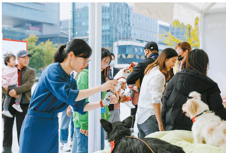
宠物领养区热闹非凡。

日前,“宠爱有家”朗东资产文明养宠公益活动暨第43届宁波领养日活动在东部新城中央广场落幕。百余名爱心人士和30组萌宠家庭通过活动,为宁波流浪动物捐赠了500公斤“口粮”,共同见证甬城文明有爱。