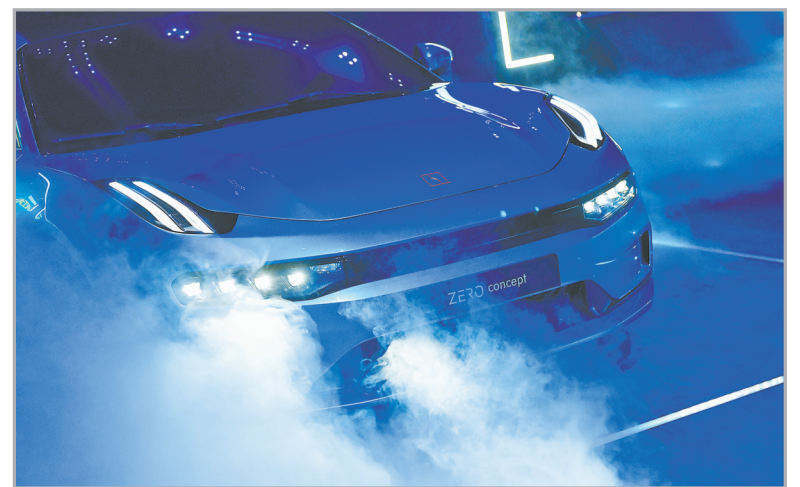
领克首款纯电动豪华轿跑“ZER0 concept”将在杭州湾新区量产。