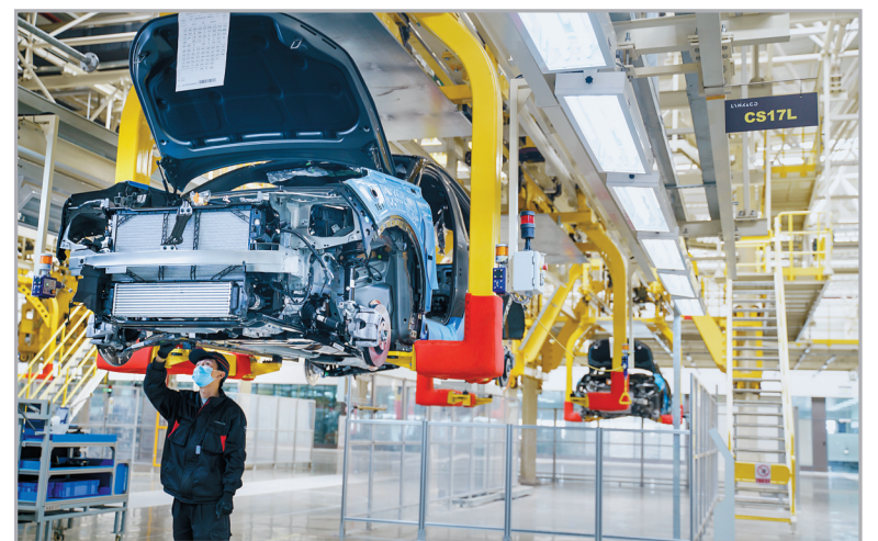
吉利在余姚的生产车间。

除了已经进军电动汽车领域的零部件企业,在记者采访过程中,也有不少企业表示虽然目前尚未在新能源汽车领域布局,公司产品主要用于传统车型,部分产品在混合动力汽车上有一定的运用。但随着