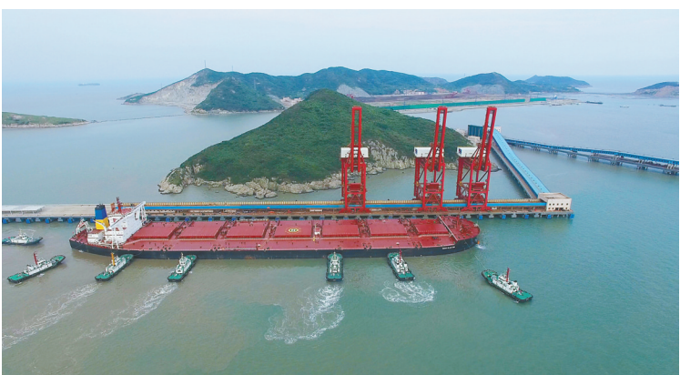
鼠浪湖矿石中转码头试靠全球最大40万吨矿船“铁巴巴西”轮。(资料照片)

宁波整车制造企业早早地进入新能源汽车领域值得庆幸,但也有业内专家给出了不同的意见。据不完全统计,目前国内市面上的新能源产品已接近200款。但随着新能源汽车新品的不断增加,其销量并没有显著的提升,最终反而被特斯拉Model 3这个“外来和尚”拔了头筹。种种迹象表明,“多生孩子好打架”的产品策略并不一定适用于新能源汽车领域,只有放慢脚步,沉淀技术,才能更好、更健康地发展。