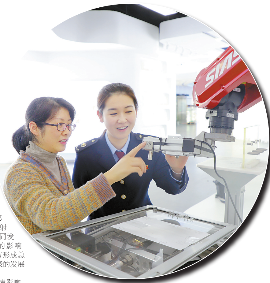
税务人员在“双十一”期间为企业精准推送税收政策“礼包”。

产业发展方面，上下游产业链齐全是最具吸引力的因素。作为全国重要的先进制造业基地，宁波拥有较为齐全的工业产业体系，形成了消费品工业、临港重化工业、装备制造和新兴产业齐头并进的发展格局，同时积极建设强大有韧性的重点产业链，加快建设一批强链补链延链产业化项目。