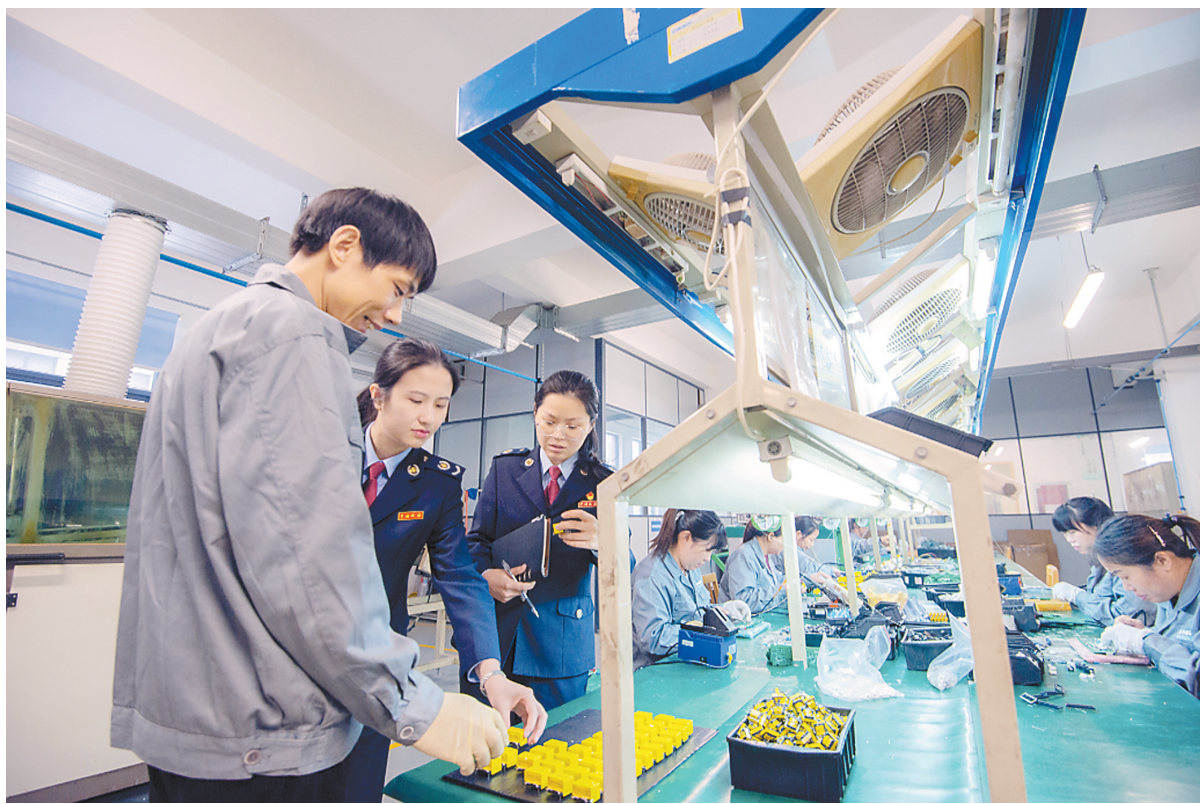
宁波市税务局大企业税收服务和管理部门走进出口企业生产车间了解情况。

最近，市税务部门对35家总部在甬千户集团进行了问卷调查和典型调研。剖析千户集团税收数据与宁波整体税收情况，可以看到作为“关键少数”的大企业在引领本地经济发展中的龙头作用；全面解读千户集团在全市经济产业发展中的现状，可以在一定程度上实现对宁波经济轮廓的解读。