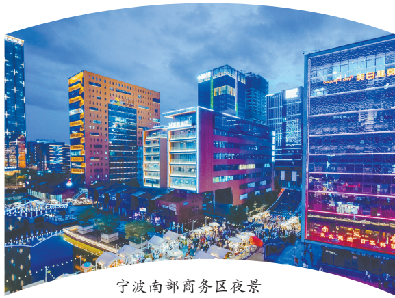
宁波南部商务区夜景