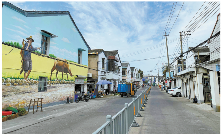
整治后的雅渡村主要村道。