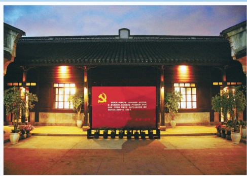
北仑区张人亚党章党史纪念馆