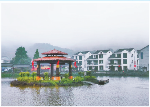
象山涂茨镇旭拱香村