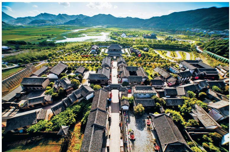
已建成的象山新桥影视城。

该镇以山海田园为本色，丰富镇域文旅项目。今年以来，青柯精品农业种植项目、台湾精品水果种植项目陆续建成投产，楠山军事田园综合体项目落地协调进度加快，关头塘美丽田园项目开工建设；西海岸风情道项目计划在蜿蜒14公里的西海岸打造数个旅游小品，串联起绿道系统，打造一条文化旅游线。美丽乡村建设成为新桥镇推进全域景区建设的一个新亮点。该镇持续打好乡村全域旅游组合拳，在已有10个景区村的基础上，今年新创建2个A级景区村、6个AA级景区村、3个AAA级景区村，成功申报省旅游风情小镇创建，逐步形成北部休闲农业带、西部滨海休闲带、中部特色文化带、南部影视文