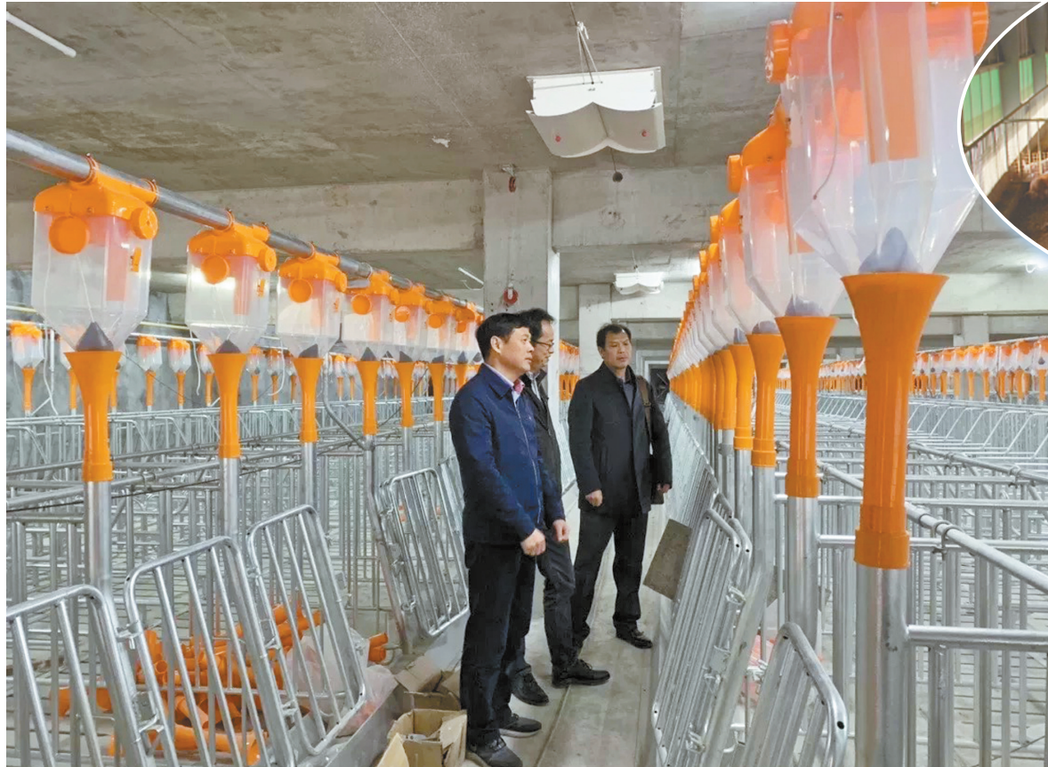
新希望公司新建成的猪舍。

经过近8个月的紧张施工,11月28日上午,新希望生态循环养殖基地项目在奉化区莼湖街道兴联村竣工。该项目占地面积217亩,投资额近4亿元,配备种猪场、公猪站及商品猪场等设施,采用自繁自育模式运作,实现绿色生态养殖和生猪增产保供的双重目的。基地负责人表示,首批将引进带胎母猪3000头,可以陆续生产,到今年年底,存栏数预计达到3万头。产能完全释放后,该养殖基地可达到年出栏商品猪15万头的规模。