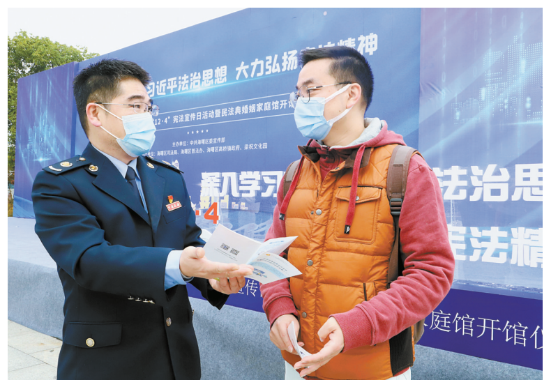
在今年宪法宣传周期间,国家税务总局宁波市海曙区税务局通过向群众普及税法知识,介绍各类税费优惠政策,进一步提升市民的法治观念和依法纳税意识,助力营造人人遵守宪法的良好氛围。