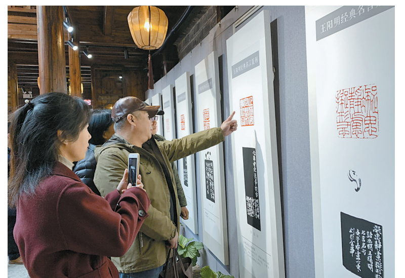
观众在参观王阳明经典名言篆刻展。

本报讯(记者陈青)方寸寄丹心,铁笔铸文章。昨天下午,王阳明经典名言篆刻展在天一艺创街·天一汇楼展出。展览为期一个月,并向公众免费开放。