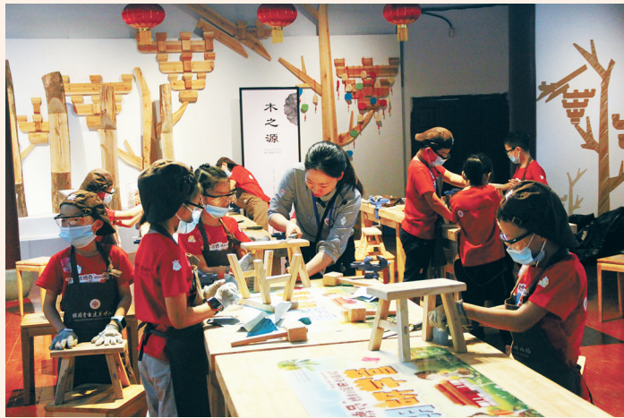
学生在保国寺参加研学活动

利用： 以“保国寺里看宋代”为题，以“文化创意+科技创新”的理念，深度阐释保国寺的文化内涵，同时构建不同建筑空间之间的联系，构建古建筑与大历史视野下的历史文化价值的联系，构建保国寺历史价值与当代文化使命的联系。保国寺展示中多维的数字化呈现手法，用今人可体验、可参与、可释读的方式“翻译”文化遗产，同时做到对古建筑的最小干预、可逆性展示，为古建筑的创意展示、创新利用开辟了一条全新路径。