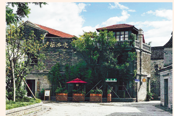
甬上枫林晚书店月湖店

利用： 随着红色研学的兴起和“不忘初心、牢记使命”主题教育如火如荼地展开，沙氏故居与鄞州区党建线路紧密结合，凭借深厚的红色底蕴，成为重要的红色地标和网红打卡点。各类红色研学及党建活动纷纷选择沙氏故居作为活动地点，沙氏故居频繁亮相于各大媒体，成为鄞州党建“金名片”。