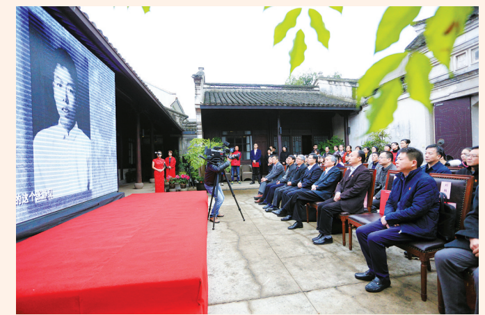
新浦老屋张人亚党章学堂

利用： 除了开辟殷夫烈士史迹陈列室外，还开展学术研究、对外开放参观，建成爱国主义教育基地、中小学德育教育基地。精心举办纪念活动，殷夫烈士诞辰一百周年纪念大会等活动吸引大量群众参与。推进“互联网+”革命文物建设，开设“团团带你走进殷夫故居”云课堂。2018年7月6日，上海广播电视台大型历史纪录片《大上海》剧组来殷夫故居取景。