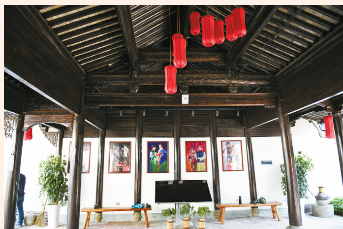
修缮后的甬剧艺术博物馆一隅

利用： 窑址现有展示面积约2200平方米，以前两期考古发掘成果为依据，在窑址区内采用原状展示和复原展示相结合的方式，全面揭示秘色瓷窑场布局和烧制工艺特点。游客可以通过水陆两条参观线路进入窑址，沿途不仅能了解古时窑业生产的地理环境面貌，也可以欣赏江南水乡风光以及周边特色农业景观。