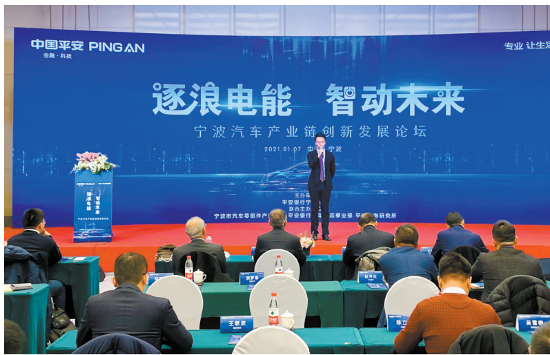
论坛嘉宾作汽车产业链创新发展主题演讲

昨日,以“逐浪电能 智动未来”为主题的宁波汽车产业链创新发展论坛隆重举行,来自汽车产业链领域的专家学者、企业人士共同探讨汽车产业链如何创新、高质量发展。 本次论坛由平安银行宁波分行、宁波市汽车零部件行业协会、平安银行汽车生态事业部、平安证券研究所联合举办,宁波当地近30家汽车行业头部企业参加。汽车零部件产业是宁波的支柱产业之一,而车生态是中国平安五大生态圈之一。 与会专家表示,汽车产业是国民经济支柱产业,正处于电动化、智能化的变革期,近年来,国家出台多项政策支持新能源车、智能网联车发展,产品要求