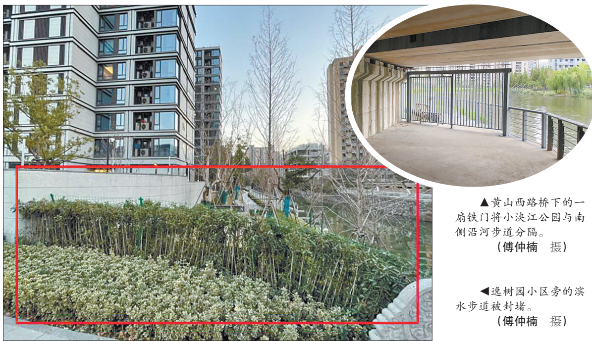
▲ 黄山西路桥下的一扇铁门将小浣江公园与南侧沿河步道分隔。

该负责人告诉记者,逸树园小区建成已有1年多,当初验收时,西侧步道是开放的,但是后期又被