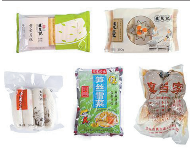
图为“五福临门”年货礼包。

有可能获得价值200元的惊喜大礼包哦。想知道是什么吗?赶快来试一试! 参与方式: 下载“甬派”App,登录后点击下方“我的”板块,并截图(见上图)发送给宁波民生e点通微信(搜nb81850),参与惊喜任务,