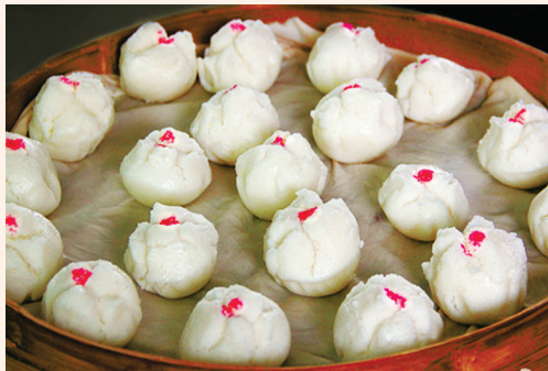
郑州大蒿的开口米馒头