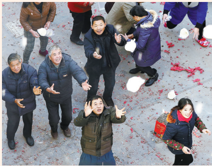
有着久远历史的“上梁抛馒头”习俗