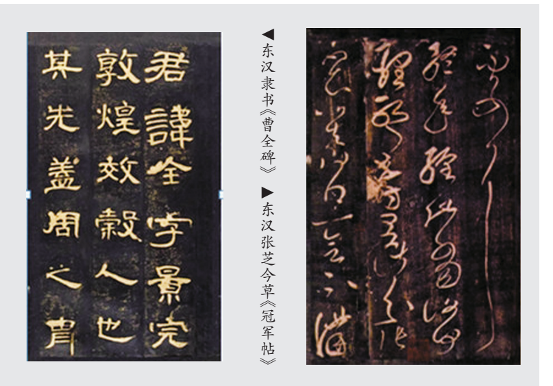
▲东汉隶书《曹全碑》 ▶东汉张芝今草《冠军帖》

在由篆而隶的书体演变过程中，主要依靠快写、省略等手段破坏和肢解原有的汉字结构和用笔方式，最终，隶书创造出了点、横、竖、撇、捺等不同特点的笔画，把图像化文字蜕变为符号化文字。