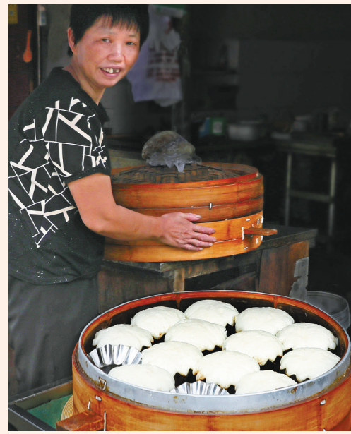
余姚丈亭街上的乌馒头