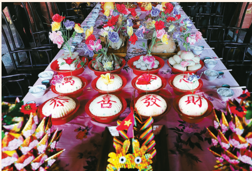
慈溪孙家境村祠堂祭祖仪式上的大馒头