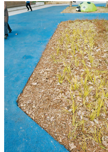
绿化内干净清爽了不少。