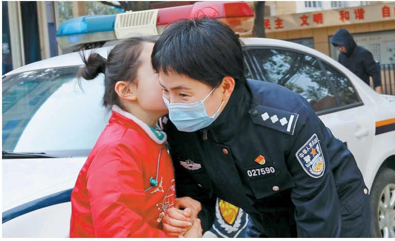
收到孩子们送上的惊喜,民警和辅警感动万分。(通讯员供图)