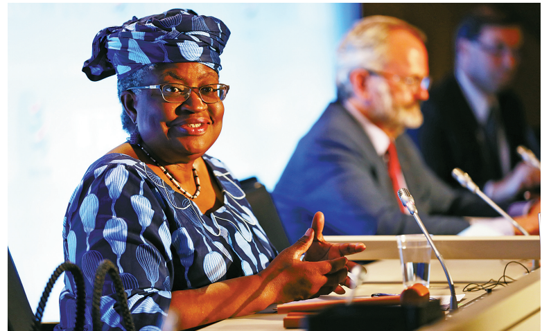
世界贸易组织2月15日正式任命恩戈齐·奥孔乔-伊韦阿拉为新任总干事。这是恩戈齐·奥孔乔-伊韦阿拉（左）在瑞士日内瓦世贸组织总部出席发布会的资料照片（2020年7月15日摄）。