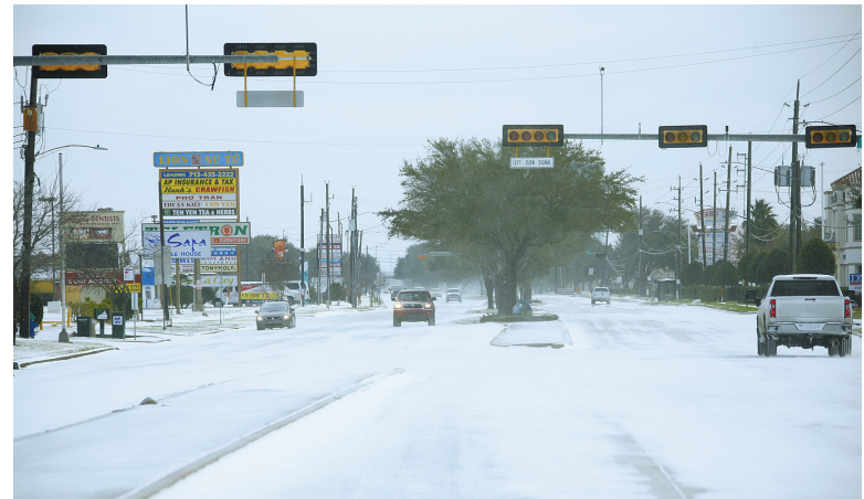
2月15日，在美国得克萨斯州休斯敦，车辆在积雪的道路上行驶。受极地寒流影响，美国南部得

克萨斯州部分地区14日夜间开始遭遇冬季风暴，造成路面结冰、道路被封以及大面积停电。