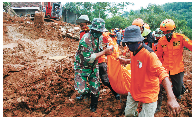
2月16日，搜救人员在印度尼西亚东爪哇省岸朱转移遇难者遗体。

由2月14日的暴雨引发的山体滑坡在印度尼西亚东爪哇省已造成至少9人死亡。