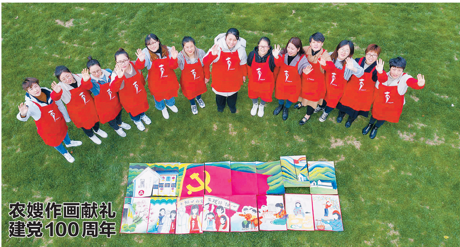
农嫂作画献礼 建党100周年

截至目前，镇海已有4家企业列入省级数字化车间名单。入选市数字化车间和通过市级验收的项目总量达21个，居各区县(市)首位。