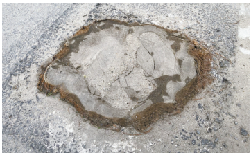
10月29日，记者在现场看到宁慈公路两侧行道树干下方的沥青

江北区住建局受理后表示，养护部门将对宁慈公路两侧的行道树设置树穴并加强观察及养护，确保行道树健康生长。