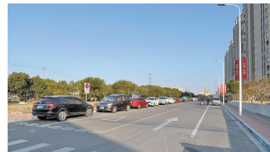
投诉时的脏乱差模样。路面上基本没有违停，隔离栏和隔离柱完好无缺。