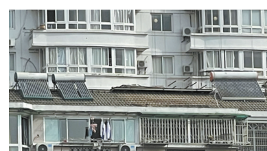
近日，记者回访看到，位于锦苑西巷15号603室楼顶的“堡垒鸽棚”已拆除。