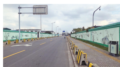
停车场围墙外的人行道边沿都放置了隔离石墩，路边已无违停车辆，也没有发现有人随地小便。