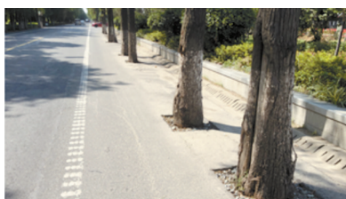
青路面上切割出了一块方形的简易“树穴”，其上还铺着些许碎石块。