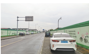
会、机场公安及其他相关部门也联合开展场区秩序管理工作。

报道刊发后，有关部门立即行动。宁波栎社机场集团有限公司在相关路段的人行道上加设了隔离石墩，防止车辆违停。公司还加强了日常巡查，对违停、随地小便的行为进行及时劝导。海曙区综合行政执法部门、临空经济示范区管委会