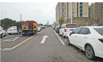
近日，记者回访看到，丰璟苑北门整条路秩序井然，一改网友最初

网友投诉后，海曙区与市公安局立即行动，对该道路进行了划线，安装了隔离柱，并对破坏隔离柱的行为进行了告知与处罚，还联合志愿者对该区域加强巡逻和监督。