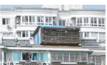
示将坚决取缔违法搭建鸽棚。同时，鄞州区信鸽协会也承诺，将共同督促养殖户自行拆除违法搭建鸽棚。

报道刊发后，东柳街道立即组织相关科室人员前往现场调查。据悉，东柳执法中队已向当事人发放了《接受调查处理通知书》，对该处违法搭建鸽棚进行立案查处，并表示将坚决取缔违法搭建鸽棚。同时，鄞州区信鸽协会也承诺，将共同督促养殖户自行拆除违法搭建鸽棚。