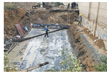
违反《浙江省违法建筑处置规定》，没收2000元违法所得，并处2.5万元罚款。（傅仲楠 海文）

3月11日，在宁海县综合行政执法局的督促下，涉事单位已完成了大坑回填和绿化补种工作。记者了解到，建设单位杨家村村委会因未取得建设工程规划许可证擅自开挖绿地，违反《浙江省城乡规划条例》规定，被处4468元罚款；萧云建设股份有限公司宁海分公司承揽明知是违法建筑的施工作业，