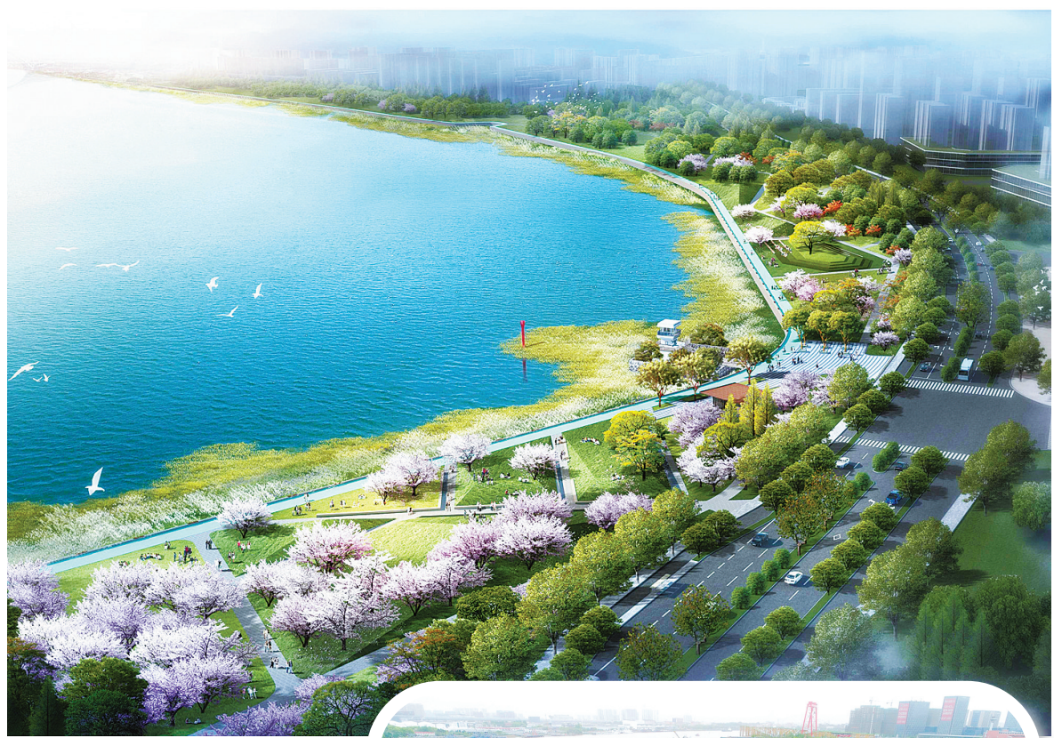
▲甬江南岸滨江绿带七期效果图