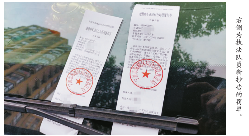
右侧为执法队员新抄告的罚单。

“其实, 中队每个执法队员都有相对固定的负责路段, 对于抄告过的车辆都有印象, 我们也提醒车主不要耍小聪明逃避处罚, 要做到规范文明停车, 共同打造安全、畅通交通秩序。”集士港中队相关负责人表示。