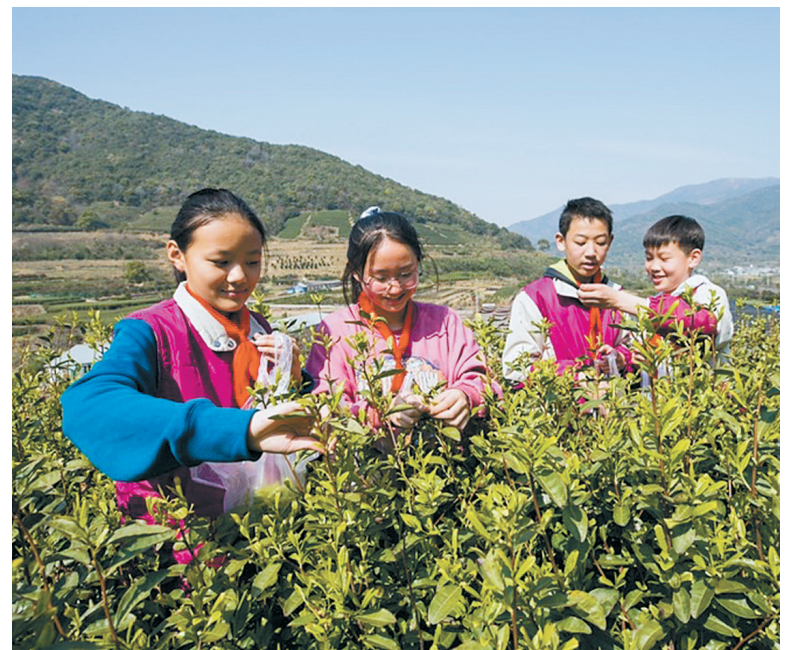
昨日，北仑区三山学校组织学生在当地茶场开展研学教育活动。通过采摘春茶，培养学生动手实践能力，让孩子在大自然中感受劳动的乐趣。