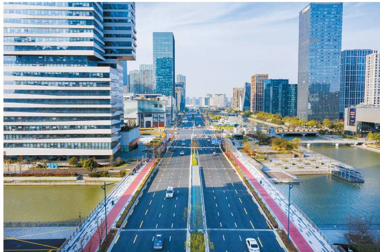
通车的海晏路（百丈东路-宁东路）段车来车往，平静有序。

宁波轨道交通5号线一期将于年内开通，地上地下、不同单位不同工序等协同共建显成效。4月份，海晏北路站将同步开放F、G出入口和地下通道，方便市民直达阪急百货商场。记者在现场看到，工程师正在反复调试F、G出入口系统设备，24小时轮换不间断施工。据了解，G出入口为阪急百货地下室直通口，F