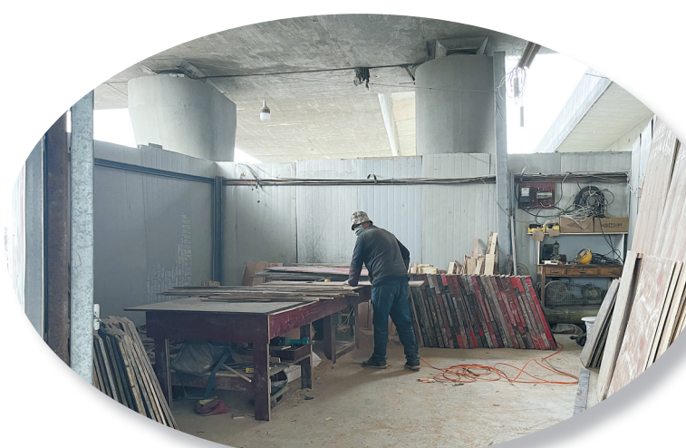
临时搭建的铁皮房内，有工人正在作业。

该铁皮屋及周边乱象仍未整改。相关进展，记者将继续关注。发现身边不文明，请您继续通过以下方式反映：