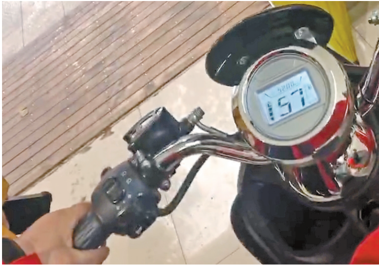
记者测试,一辆上牌电动自行车速度可至57公里/小时。

本报讯(易民)近日,宁波市文明创建市民巡访员“缘于月湖”在中国宁波网民生e点通群众留言板发帖反映,电动自行车相关新规出台后张榜公布于我市各个经销场所,但新规的车辆25公里/小时的限速并没有真正执行,而只是被商家挂在了墙上,很多品牌店可以在办理牌照后进行提速,买家只要付10元费用,时速就可提到50公里以上。