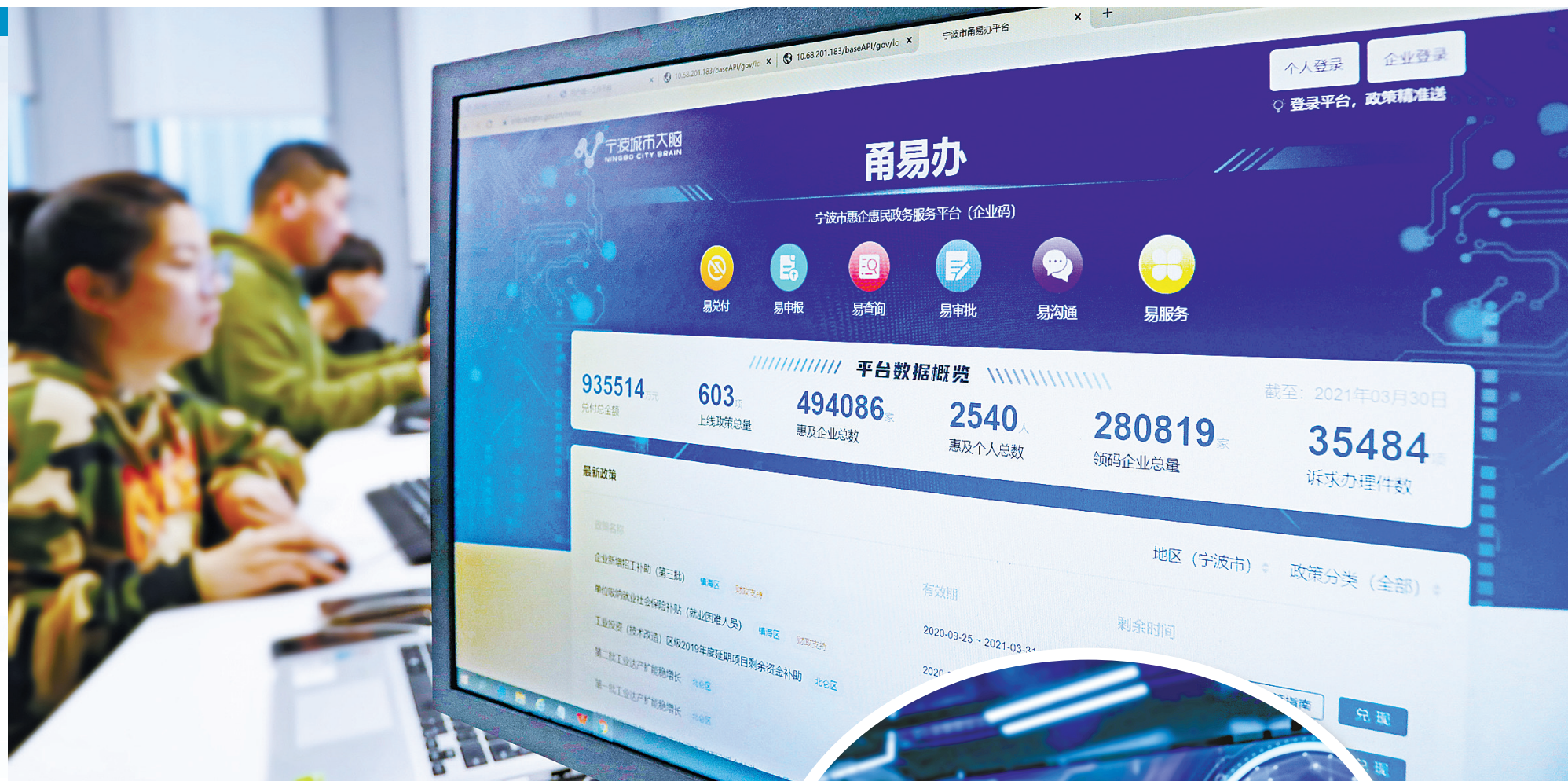
▲ 图为“甬易办”操作界面。