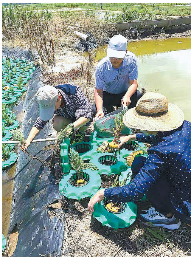
科技特派员在工作中。(资料图)

当传统塑料制品的价格越来越高，替代包装材料的价格逐步降低，此消彼长，在违法违规的高额成本面前，顺应环保要求自然会成为行业的普遍自觉。推动落实“新限塑令”，加快关联经济政策配套，为市场替代注入内在动力，应是限塑全国一棋的重要内容。