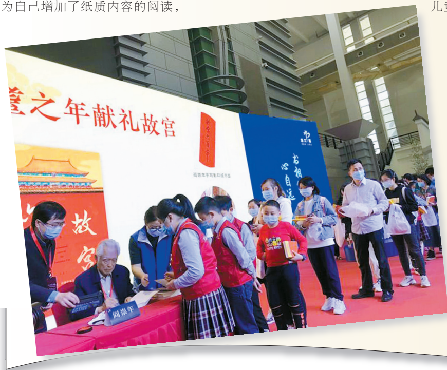
2020浙江书展上，宁波读者排着队请作家阎崇年在他的新书上签名。

对亲子早期阅读行为的分析发现，我市0—8周岁儿童总体家庭阅读氛围良好。调查数据显示，2020年，我市0—8周岁儿童家庭中，平时有陪孩子读书习惯的家庭占89.4%，远高于2019年全国平均水平的70.0%。随着亲子阅读整体氛围的提升，0—8周岁儿童家长在陪读时长上花费了更多精力。有过亲子共读行为的0—8周岁儿童家庭中，家长平均每天花费31.65分钟陪孩子阅读，高于2019年宁波的27.86分钟和全国平均水平的24.98分钟。此外，2020年，我市0—8周岁儿童的家长带孩子逛书店平均为3.80次，四成以上(42.0%)的我市儿童家长半年内至少会带孩子逛一次书店。