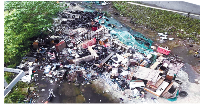
庆丰桥匝道下空地堆满垃圾。