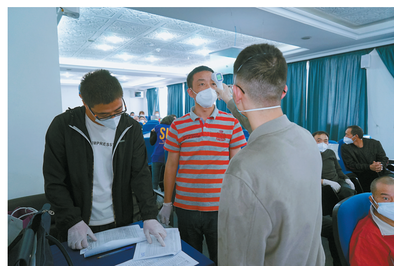
5月5日，一名身处突尼斯的中国公民（中）在突首都突尼斯市一处接种点进行接种新冠疫苗前的体温检查。