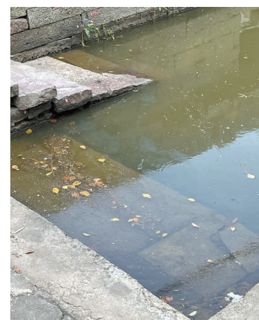
周韩东河河堤头边的河面漂浮着许多泡沫和垃圾。

编号为“118373”的网友：姜山镇周韩村附近河道内出现大量死鱼，河水浑浊不堪，猜测是由农业用水污染引起。