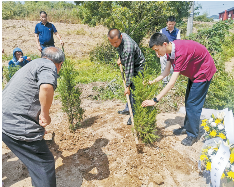
梁家人正在种植柏树。