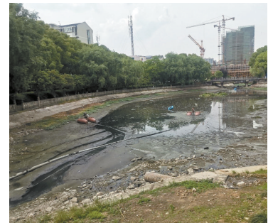
镇海宁大步行街旁河道还在抽水当中，河水仍较浑浊。

宁波市文明创建市民巡访员“小张”：宁波大学北校区步行街附近的一条河，可能是死水的关系，越发臭了。这个地方平时人流量众多，附近是学生宿舍，天气热了有