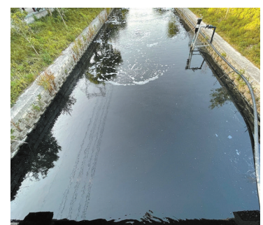
陈黄村幸福长廊东侧蔡家漕河水已呈墨黑色。

网友“自由天空12”：鄞州区云龙镇陈黄村幸福长廊边上的河道水体发黑，还伴着阵阵恶臭。