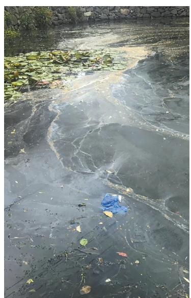
湖塘片河河面上漂浮着大量油污。

宁波市文明创建市民巡访员“爱家园”：北仑区灵峰山公路旁边的郭隘村河和湖塘片河越来越脏了。河边有管子源源不断地向河里排水。