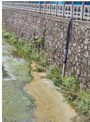
悦秀明湖府工地正在向前旺坑河中排水，河面漂浮大量黄色污物。