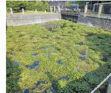
集贤桥下河里长满水草。

编号为“118577”的网友：鄞州区首南中路集贤桥下方的河水恶臭扑鼻，路过时往桥底一看，不