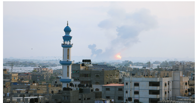
这是5月11日在加沙地带拉法拍摄的空袭现场。5月11日,以色列继续轰炸巴勒斯坦伊斯兰抵抗运动(哈马斯)位于加沙地带的军事目标。巴勒斯坦卫生部门官员11日说,以军从10日开始的轰炸造成巴方至少23人死亡,其中包括9名儿童,另有110人受伤。

万平方米,展示商品4000余种,在全国设立了36个中东欧特色商品直销中心。同时在宁波保税区设立了中东欧商品的贸易物流园,开设线上常年展,并与国内知名电商平台合作,助力更多中东欧商品借力跨境电商,寻路中国市场。