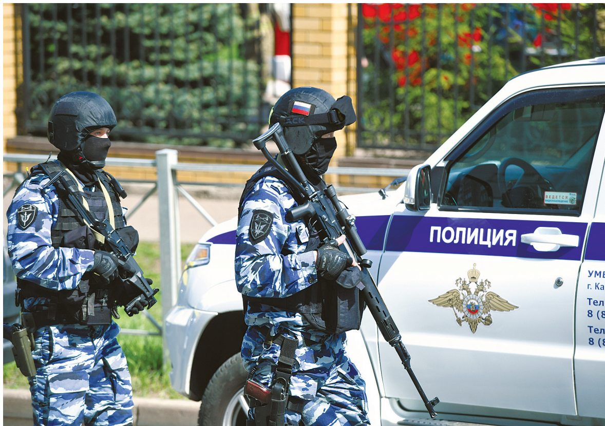
5月11日,防暴警察在俄罗斯喀山市发生枪击事件的学校外。