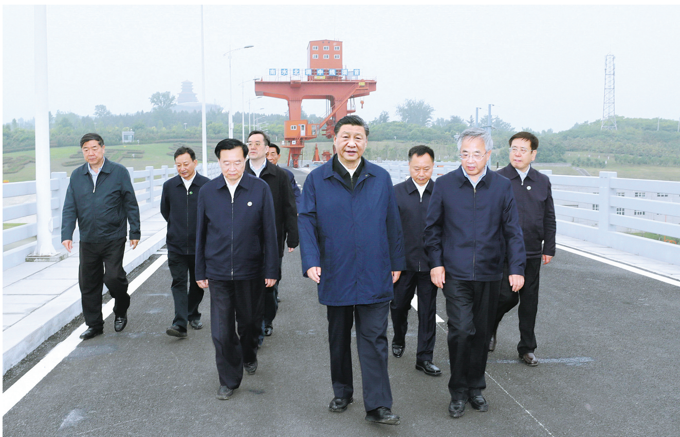
5月14日上午,中共中央总书记、国家主席、中央军委主席习近平在河南省南阳市主持召开推进南水北调后续工程高质量发展座谈会并发表重要讲话。