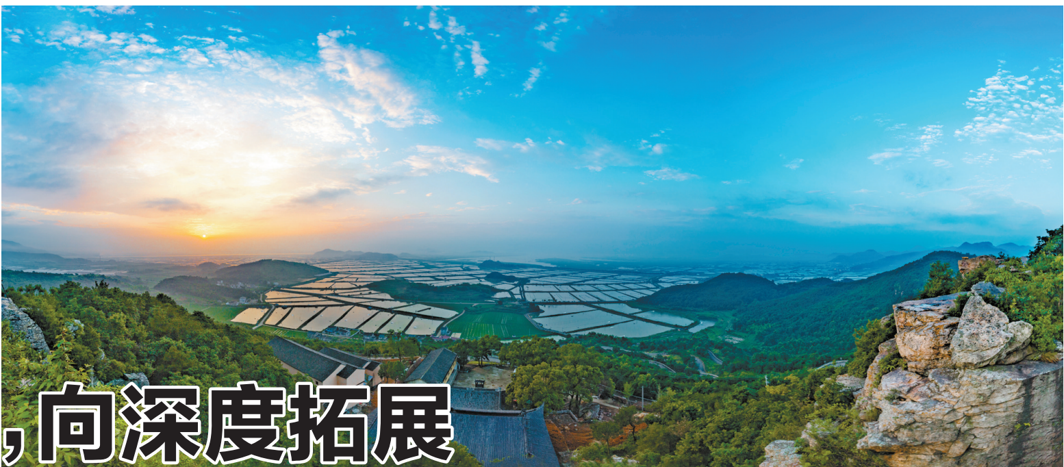
宁海王千山沧海桑田日出美景

据悉,本次申报“入库”工作网络开放时间为5月18日至28日,逾期自动关闭,网址为“宁波市科技管理信息系统”(http://program.sti.gov.cn)。通过初步审核、部门复审、尽职调查、部门联审后,符合条件的企业经社会公示无异议后“入库”储备。