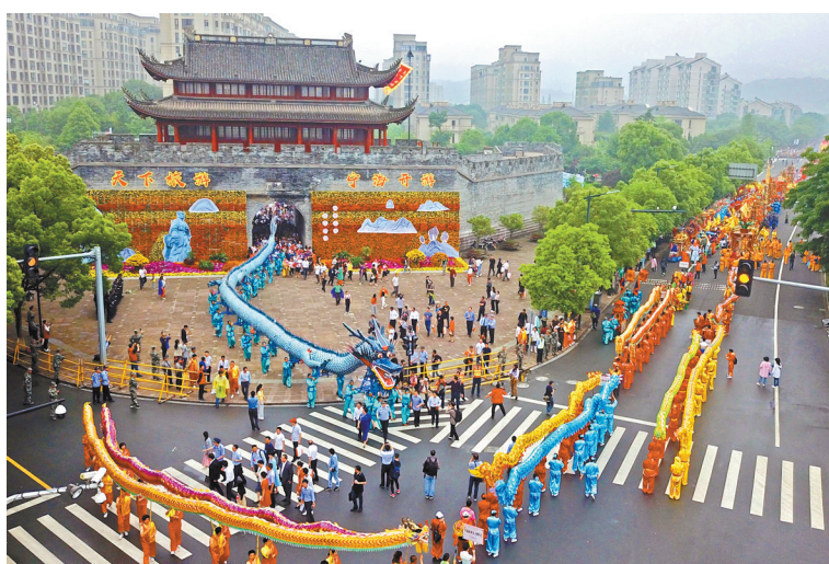
往届徐霞客开游节盛况