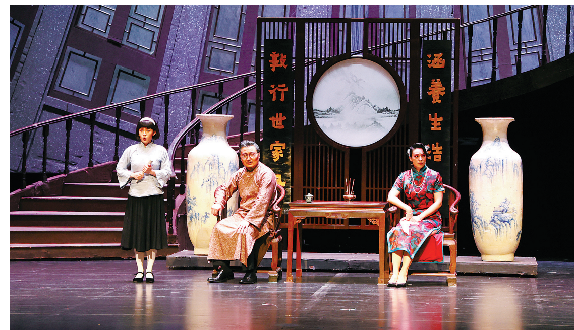
昨晚，红色经典话剧《共产党宣言》在天然舞台上演。

话剧《共产党宣言》由唐栋、蒲懿担任编剧，傅勇凡执导。该剧曾荣获舞台艺术最高奖“文华大奖”，是宁波市庆祝建党100周年全国优秀舞台剧目展演引进的重点剧目之一。该剧以现代的手法演绎了一个早期中国共产党人的革命故事。上世纪20年代，中国革命风起云涌，中国共产党与国民党反动派进行着生死较量。话剧《共产党宣言》以这一时代为背景，以马克思、恩格斯《共产党宣言》为思想主线。全剧只有两个主场景——大宅院和监狱，虽然设计简单，却寓意深刻：在大宅院生活美好，却面有愁容、心有郁结；在监狱，虽然失去自由，还面临死亡的威胁，却因为有信仰而热血沸腾、激情昂扬。在跌宕起伏、扣人心弦的剧情中，观众一次又一次被剧中情节和人物感动，被革命者坚定的革命信仰深深感染。