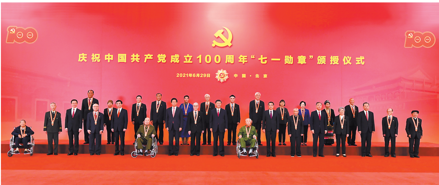
▲6月29日，庆祝中国共产党成立100周年“七一勋章”颁授仪式在北京人民大会堂金色大厅隆重举行。中共中央总书记、国家主席、中央军委主席习近平向“七一勋章”获得者颁授勋章并发表重要讲话。 ▲习近平等领导同志同“七一勋章”获得者合影。